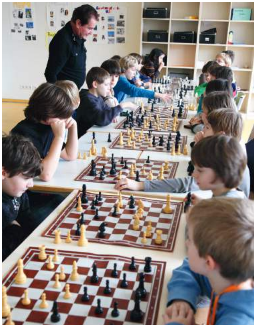
Ein Thema der Schulkonferenz: Die Einrichtung von Ganztags- und Betreuungsangeboten